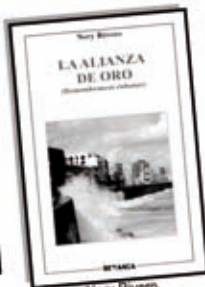
Nery Rivero La alianza de oro