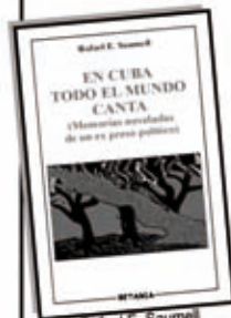
Rafael E. Saumell En Cuba todo el mundo canta