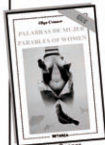
Oiga Connor Palabras de mujer