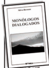
Silvia Burunat Monólogos dialogados