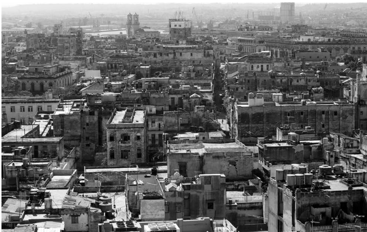
Author: Jaroslav Jiricka

No es posible hacer una valoración objetiva del impacto que pueda tener la ley, hasta tanto no se disponga del Reglamento para su aplicación y de las políticas reales que se ejecutarán en la práctica. En muchas ocasiones buenas ideas y planes en el campo económico han sido destruidos en su aplicación. La Ley establece que el Consejo de Ministros tiene 30 días para dictar el Reglamento para la implementación de la entrega de las tierras.